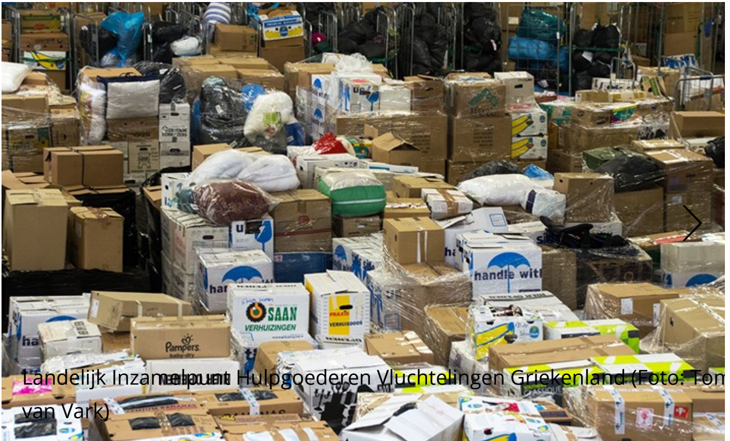
Landelijk Inzamelingspunt Hulpgoederen Vluchtelingen Griekenland