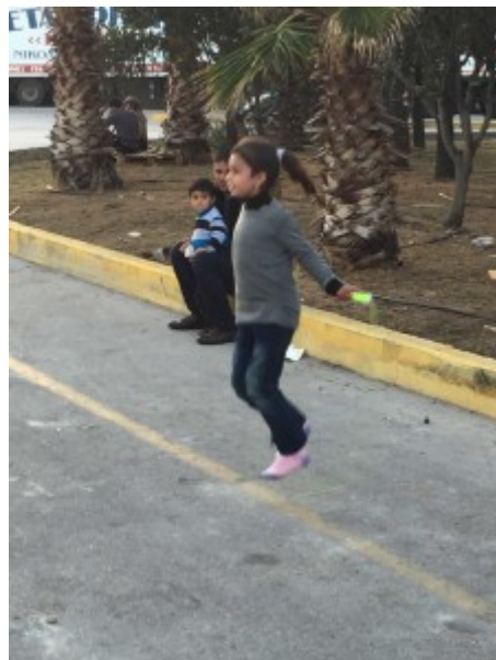
( http://btersago.com/blog/wp-content/uploads/2016/03/IMG_6552.jpg )

Touwtje springen met de vrijwilligers die de kinderen bezig houden